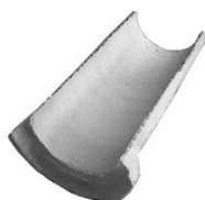
Modelo de referência com junta rígida ponta e bolsa 60x100cm.

As canaletas deverão ser assentadas sobre 5cm de concreto magro, para a fixação e após colocadas deve-se realizar o rejuntamento das peças e o entorno necessário.